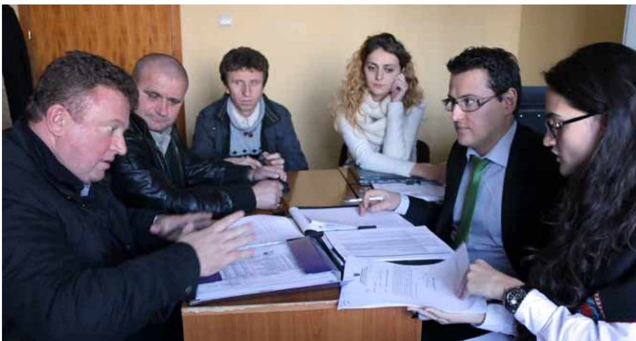
Ekspertë të kompanisë KPMG dhe stafi i njësive vendore gjatë punës në një nga bashkitë pilote, Pogradec

Metodologjia e hartuar në këtë fazë pilotimi synon të orientojë qartë kryetarët e 61 bashkive të reja jo vetëm përgjatë procesit të bashkimit, por edhe më pas, në atë të konsolidimit të një qeverisje vendore moderne, eficiente dhe transparente.